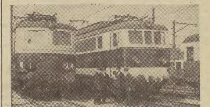
Na zdjęciu: elektrowozy w coraz większym stopniu wypierają z naszego kolejnictwa parowozy.

Duże znaczenie dla rozwoju gospodarczego ziemi łódzkiej ma budowa linii kolejowych War-