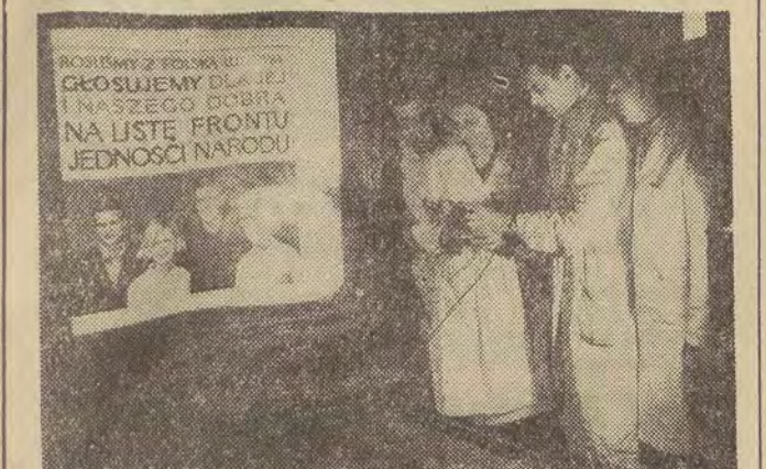
Oto jeden z plakatów wyborczych wydawanych przez Wydawnictwa Artystyczno-Graficzne, a drukowany w Łodzi w nakładzie 50 tys. Jego autorem jest M. Raducki.