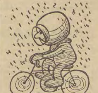
Strój kolarski na deszczową pogodę. Rys. K. Baraniecki