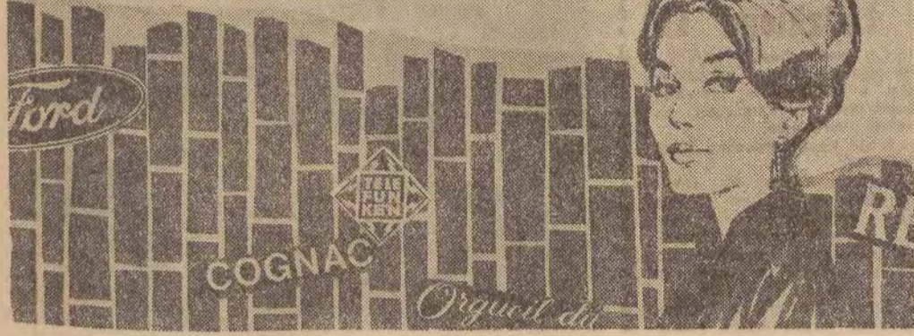
Tłumaczyły: EMILIA BIELICKA i TERESA JĘTKIEWICZ