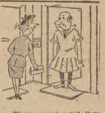
- Dlaczego pani pyta? Oczywiście, że żona jest w domu...