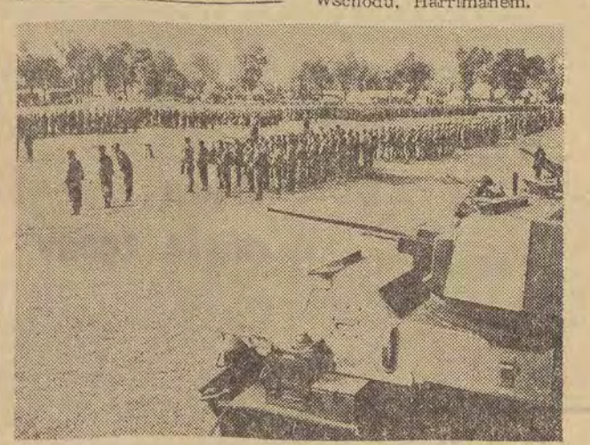
Sprawa Zachodniego Iranu dojrzywa z każdym dniem. Rząd indonezyjski i prezydent Republiki dr Sukarno postanowili w wypadku jeśli wysiłki dyplomatyczne nie dadzą pozytywnych wyników, wyzwolić zachodnią część Nowej Gwinej wszelkimi dostępnymi środkami wojskowymi. Na zdjęciu: oddziały indonezyjskie przygotowują się do defilady w dniu święta armii.

Zwracamy się do kierowników oddziałów produkcyjnych, inżynierów, techników i mistrzów, aby interweniowali w dyrekcyjach zakładów oraz w Dziale Eksportu Zjednoczenia Przemysłu Bawełnianego w sprawie napotykanego w pracy trudności, aby nie dopuścili do sytuacji, w której wykonanie