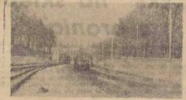
„budowa mostu przy ul. Żelazkiej dawno już została zakończona. Wybudowano nową piękną trasę komunikacyjną, która oddano do użytku w połowie grudnia ub. roku. Dziw, że nie dostrzegli tego ludzie odpowiedzialni za znaki drogowe w naszym mieście. (K)