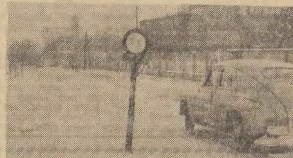
Zakaz wjazdu — budowa mostu. Ten znak drogowy, który od kilku miesięcy możemy oglądać na ul. Teresy, jest już dawno nieaktualny. Wprowadza w błąd kierowców. Mało zresztą kto przestrzega zakazu wjazdu, jako że...