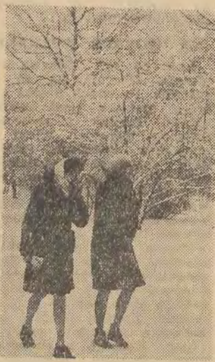
Warunki śnieżne niestety nie są najlepsze, ale amatorzy białego szaleństwa mogą poprobować jazdy na nartach. Okazja nadarza się, bo w niedziele PTTK organizuje wy-

cieczkę autokarem do Smardzowa (Zapisy przy ul. Piotrkowskiej 104).