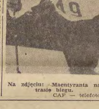
Na zdjęciu: Maentyranta na trasie biegu.

W zakończonych w fińskiej miejscowości Imatra mistrzostwach świata w jeździe szybkiej kobiet, Elwira Seroczynska zajęła w wieloboju IX miejsce. Pierwsze dwie lokaty przyznały zawodniczkom ZSRR - Woroninie i Iwanowej. Bieg na 1000 m. W zawodach z udziałem Skoneckiego i Orlikowskiego akcje w 5 setach. W rewanżowym spotkaniu, rozegranym w Sztokholmie, hokeiści tabeli AZS AWF 13 i Legii 0:3. Finały bokserskich mistrzostw okręgu łódzkiego przyniosły na czołowe miejsca zawodniczki z drużyny z Łodzi: W. Lapię, który odbe dział w Poznaniu w dnach 24-25 bm.