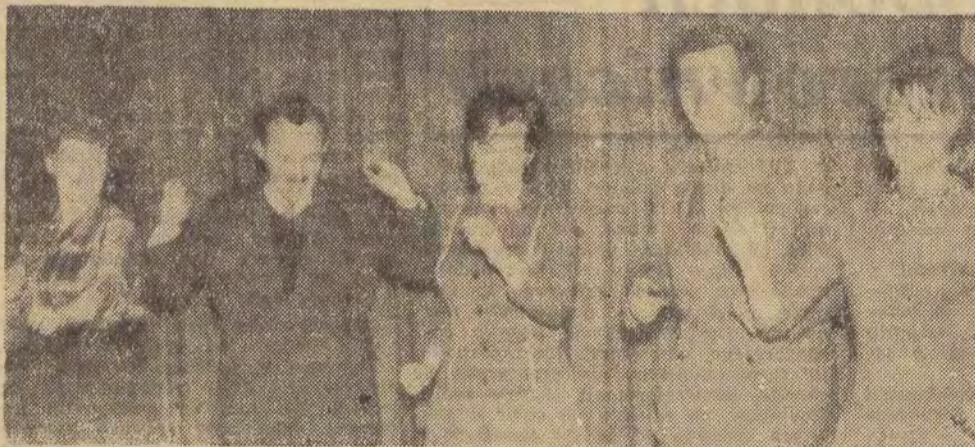
Zespół estradowy Domu Kultury Nauczyciela — w scenie zbiorowej.