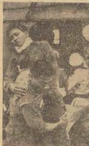
Na zdjęciu: sanitariusze sajsgońskich wojsk rządowych ewakuują rannych z rejonu walk.

W Moskwie podano, że premier rządu szwedzkiego, Tage Erlander odwiedzi Związek Radziecki w dniach 10-17 czerwca br.