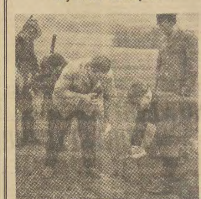
Koło Łowickie nr 4 postanowiło w czynie społecznym zasadzić koło Nowosolnej 10 tys. drzewek. Projekt już zrealizowano. Sadzenie drzewek zaczęło się także młodzież szkolna z Nowosolnej. Blisko 150 dzieci z klas V, VI i VII do tej pory zasadziło już prawie 50 tys. drzewek. (k)