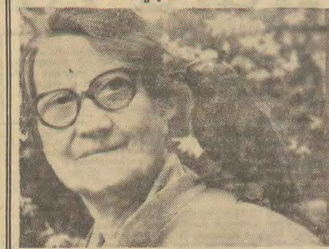
Kawka też potrafi mówić. Ta, którą widzimy na ramieniu swojej pani, umie podobno kilka słów. Przy nas — niestety — nie nie powiedział. Podobno nie lubi popisywać się przed obcymi. (k)