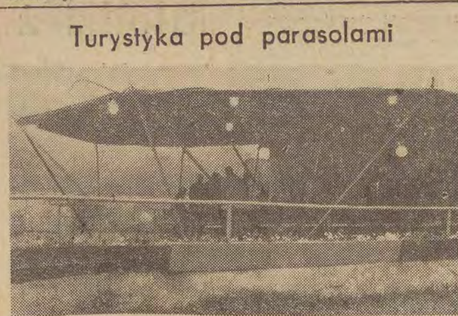
Turystyka pod parasolami

czasowych straty w pojedynczej bitwie w wojnie wietnamskiej.