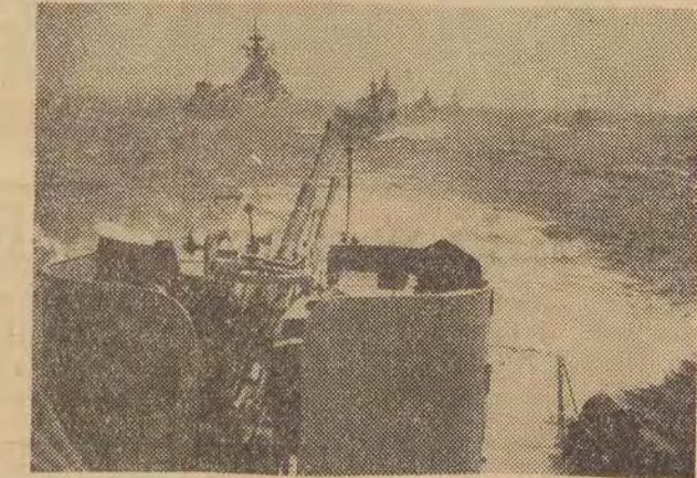
Dnia 27 bm. z okazji Dni Morza i Święta Marynarki Wojennej odbyła się na wodach Zatoki Gdńskiej wielka parada morską okrętów naszej Marynarki Wojennej oraz wiarygodnych nasz kraj wojennych okrętów radzieckich i okrętów NRD. Na zdjęciu: fragment parady okrętów MW.