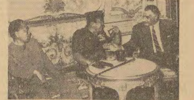
Trzej przywódcy afro-azjatyccy: premier Czou En-laj, prezydent Sukarno oraz prezydent Naser w czasie niedzielnego spotkania w Kairze po odroczeniu algierskiej konferencji na szczycie.

W drugim punkcie UGTA podkreśla, że jednym z aspektów wydarzeń z 19 czerwca jest obecność lub powrót na