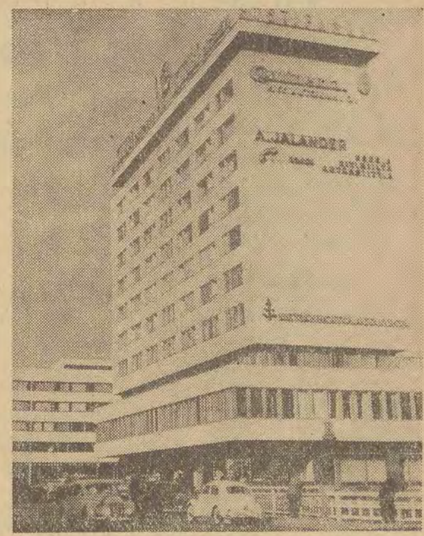
NA ZDJĘCIU: Centrum miasta Oulu, położone nad Zatoką Botnicką.