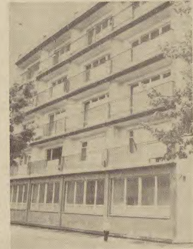
Dom przy ul. Stockiej 13 III nagroda „Złotej Kielni”

Laureatom składamy serdeczne gratulacje, a Czytelnikom, którzy listami swoimi pomogli jury w pracy, przekazujemy tą drogą gorące podziękowania.