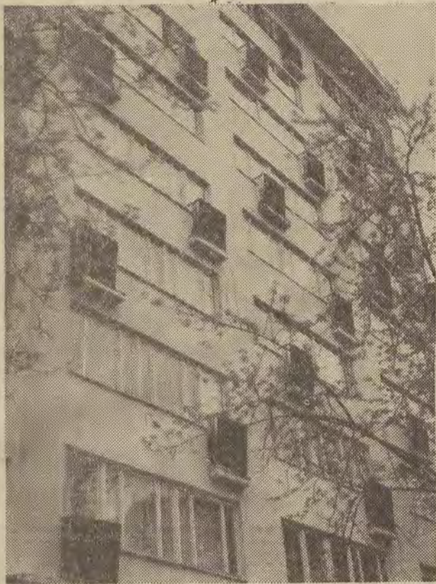
Dom przy ul. Piotrkowskiej 141 II nagroda „Złotej Kielni”

Jury naszego corocznego konkursu o „Złotą Kielnię m. Łodzi — 1965” w wyniku szczegółowej analizy dokonanej w toku dość długiej dyskusji orzekło, które domy zasługują w br. na miano najlepszych.