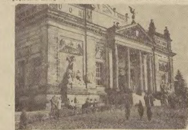
Na zdjęciu: Tu, przed 15 laty podpisano układ pomiędzy Polską i NRD.

kalne, na dawnych peryferiach powstały całe dzielnice mieszkaniowe, na ulicach ruch, wszędzie pełno samochodów ze znakami rejestracyjnymi miast całej Polski i innych państw. Nowe szkoły, sklepy, kawiarnie i kluby, doskonale wyposażony szpital, kilka szkół podstawowych, Technikum Górnicze, kilka tysięcy nowych izb mieszkalnych, nowe restauracje i placówki usługowe, nowoczesny piękny hotel, jakiego nie powstydziłaby się nawet stolica. Bez przesady — zupełnie