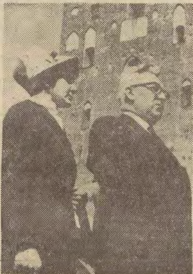
Na zdjęciu - E. Ochab w Turku.

W dniu 3 lipca przewodniczący Rady Państwa, Edward Ochab odwiedził w godzinach popołudniowych miasto Turku, znane centrum kulturalne Finlandii.