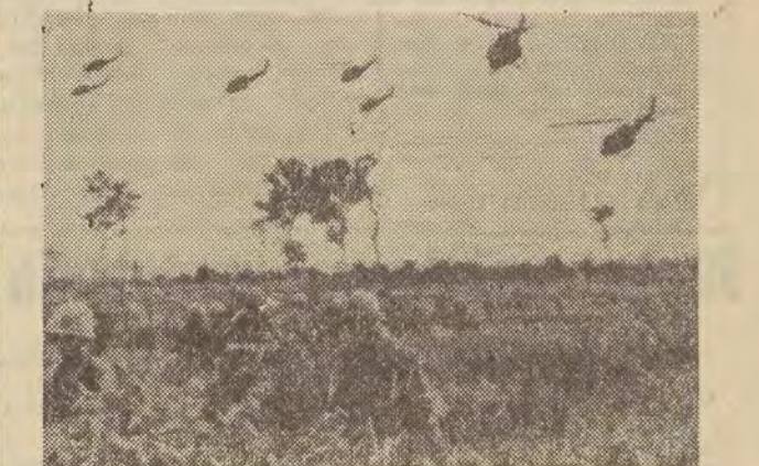
Na zdjęciu: spadochroniarze amerykańscy brną przez wysoką trawę po lądowaniu w Xo Ba Da.

Drugi oddział piechoty mor- Rzecznik dowództwa amerykańskiego w Da Nangu oświadczył, iż nowe posiłki zwiększyły ogólną liczbę żołnierzy USA w Wietnamie do przeszło 60 tys. Do amerykańskiej bazy lotniczej Bien Hoa w południowym Wietnamie przybyła przednia grupa żołnierzy no-