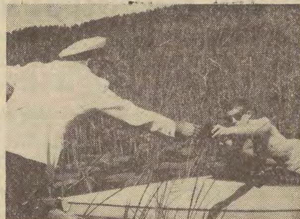
Alarm na plażach i kąpieliskach trwa. Nad bezpieczeństwem pływających, na plażach strzeżonych i kąpieliskach zamkniętych, czuwają ratownicy. Natomiast na wodach otwartych i nie strzeżonych jeziorach i rzekach specjalne jednostki Milicji Obywatelskiej pełnią służbę, mającą na celu zapobieganie utonięciom nierozważnych „pływaków” nie umiejących pływać. Praca rzecznej MO polega na sprawdzaniu kart pływackich wśród kajakarzy, wiosłarzy i żeglarzy. Bardzo często MO musi udzielać konkretnej pomocy niedoszłym topielcom. (2) NA ZDJEĆIU: sprawdzanie karty pływackiej u użytkownika kajaka na jeziorze Rospada (Augustów).