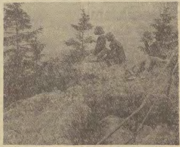
Kudowa, Duszniki i Polanica leżą u podnóża Gór Stołowych. Bogactwa form skalnych i labirynty wąwozów są wielką atrakcją turystyczną. Na zdjęciu: wczasowicze leżnie odwiedzają Góry Stołowe.