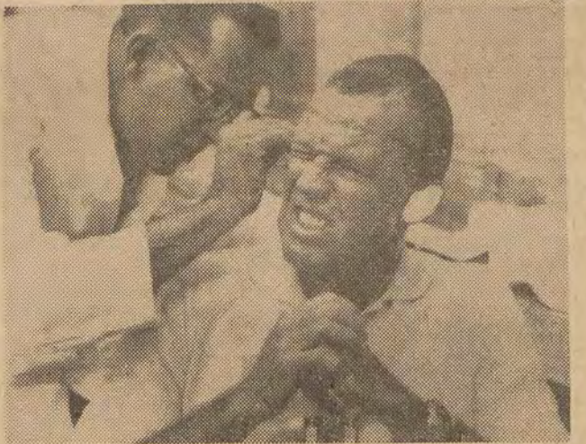
Na zdjęciu: Gordon Cooper podczas badania lekarskiego na kilkadziesiąt godzin przed planowanym startem.

Z powodu usterek technicznych oraz niesprzyjającej pogody, amerykańska Agencja Aeronautyki i Przestrzeni Kosmicznej (NASA) postanowiła odwołać próbę umieszczenia w czwartek na orbicie wokółziemskiej kabiny „Gemini-5” z dwoma kosmonautami, Gordonem Cooperem i Charlesem Conradem na pokładzie.