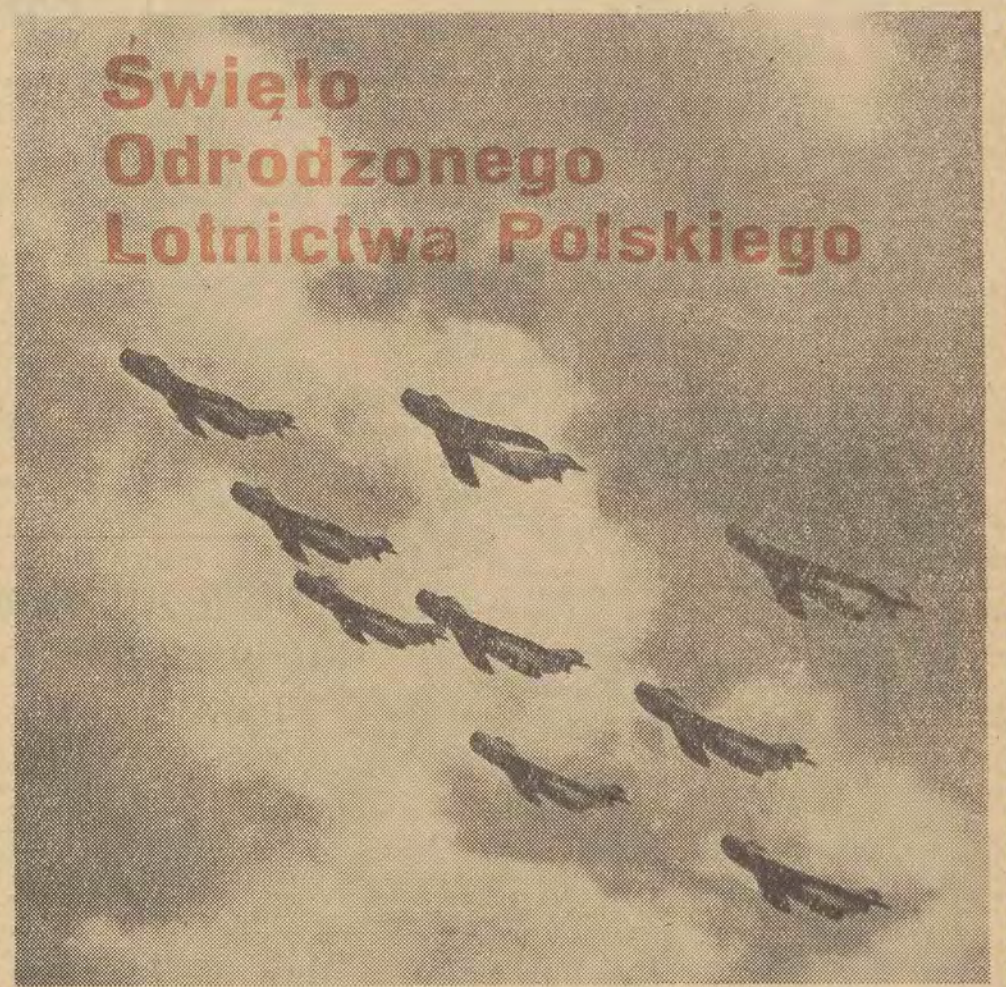
23 bm. mia 22 lata od dnia, gdy na małe lotnisko polowe w Grigoriewskoje w ZSRR, przyjechała grupa 30 żołnierzy polskich, która dała początek pierwszej jednostce lotnictwa Ludowego Wojska Polskiego. Dziś polskie lotnictwo stanowi potężną siłę obronną, strzegącą w powietrzu naszych granic. Na zdjęciu: dziesiątka myśliwców w szyku defiladowym.

do wiadomości, że po dokładnym obliczeniu parametrów orbity okazało się, że jest ona w perigeum niższa od zaplanowanej, a koniecznej dla przeprowadzenia doświadczenia z wyszczerzeniem i następnie do ściąganiem małego satelity biegnącego po tej samej orbicie co „Gemini-5”. W związku z tym w połowie pierwszej okrażeń, gdy kabina znalazła się nad Australią, kosmonauci włączyli specjalne silniki zwiększające szybkość, dzięki czemu orbita osiągnęła w апогеum 349 kilometrów, a w (A) Dalszy ciąg na str. 2