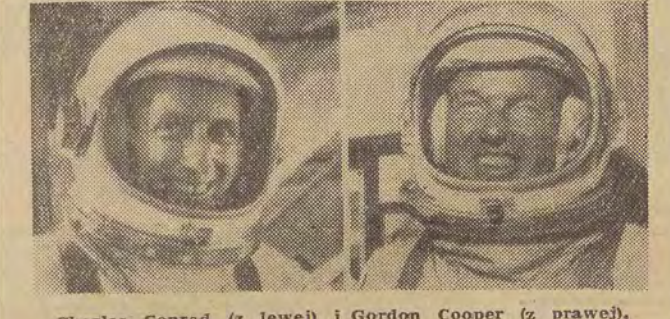
Charles Conrad (z lewej) i Gordon Cooper (z prawej).