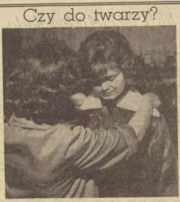
Czy do twarzy? Coraz więcej młodzieży szkolnej wraca do miast. W sklepach z przyborami szkolnymi i mundurkami ruch rośnie. Na zdjęciu: fartuszek musi leżeć idealnie.