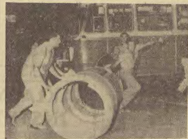
Na zdjęciu: demonstranci w Atenach toczą cementowe rury na barykadę.

manis oświadczył, iż rząd jest zdecydowany „nie tolerować” na przyszłość żadnych nowych wystąpień zakłócających ład publiczny; organizatorów takich wystąpień będą aresztowani i oddawani pod sąd.