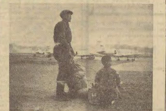
W porcie lotniczym Ulan Bator.