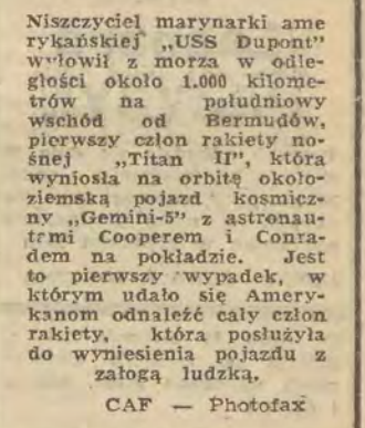
Niszczyciel marynarki amerykańskiej „USS Dupont” wylądował z morza w odległości około 1.000 kilometrów na południowy wschód od Bermudów, pierwszy człon rakiety noszącej „Titan II”, która wyniosła na orbitę okołoziemską pojazd kosmiczny „Gemini-5” z astronautami Cooperem i Conradem na pokładzie. Jest to pierwszy wypadek, w którym udało się Amerykanom odnaleźć cały człon rakiety, która posłużyła do wyniesienia pojazdu z załogą ludzką.