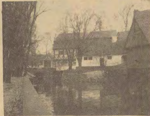
„Den gamle By” — stary młyn nad kanałem.

Być w Aarhus i nie widzieć „Den gamle By”, to gorzej niż przejechać przez Rzym i nie widzieć papierni. Po takiej opinii przyszedłem znajomego — zagadnął mnie ten starszy pan, gdyśmy wspólnie kontemplowali w katedrze największy w Danii fresk „Człowiek z mieczem” — nie pozostało mi nic innego jak dopytać się o drogę. Doprowadził mnie do ulicy Thorvaldsena. — Pójdź pan prosto i dojdzie do „Den gamle By” — powiedział, uściślał mi serdecznie drogę i odszedł.