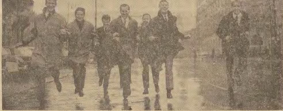
Rok 1964. Zespół „Chanteurs de Paris”. Piosenkarze wystąpili w Warszawie, Gdańsku, Wrocławiu, Wałbrzychu, Krakowie i Tarnowie.