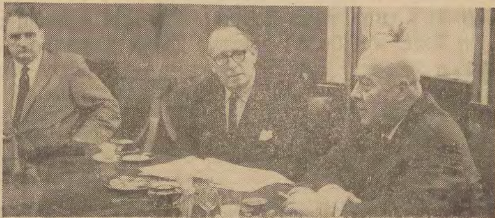
Warszawa rok 1965. Grupa parlamentarzystów francuskich z przewodniczącym Maurice Schumannem została przyjęta przez premiera J. Cyrankiewicza.

Zdjęcia nasze z ostatnich dwóch lat są ilustracją niektórych kontaktów polsko-francuskich na polu politycznym, gospodarczym, naukowym i kulturalnym.