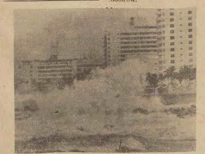
Na zdjęciu: potężne fale, pędzone przez huragan „Betsy” rozbijają się o falochron w Miami Beach na Florydzie.