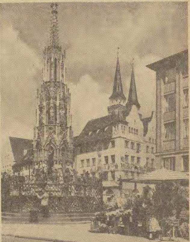
2. 9. - NORYMBERGA. - 6 DZIEŃ PODRÓŻY

Piszę*) tę kartkę już na szosie za Norymbergą, z której, acz z trudem, jednak wyjechałem. Liberec opuściliśmy we wtorek, 31. 8. przed południem, zamierzając dobić aż do granicy CSRS - NRF. Z Pilzmem złapał nas jednak ulewny deszcz, który trwał przez całą dobę. Stał się w południe pod namiotem. W środę po południu trochę się przetrzało, jednak znów lunęło, gdy tylko ruszyliśmy. Ostatnią noc w CSRS spędziliśmy w hotelu, gdzie nam specjalnie napalono w pokoju, byśmy mogli wyschnąć. Dziś od rana jedziemy już przez NRF. Nie mała trasa od granicy do Norymbergi - zurbanizowana, ruch obrotowy, stale służąca zwanym ze światłami. Zwiędzamy miasto, po czym startujemy w kierunku na Karlsruhe. „Peżocik” z 2-osobową załogą i 50-kilogramowym bagażem jakoś wytrzymał przejazd przez miasto w tempie 70 km na godz. Pogoda poprawiła się, jest prawie upał. Jutro mamy nadzieję przeloczyć granicę francuską. W NRF nie spotkaliśmy dotąd żadnego polskiego pojazdu.