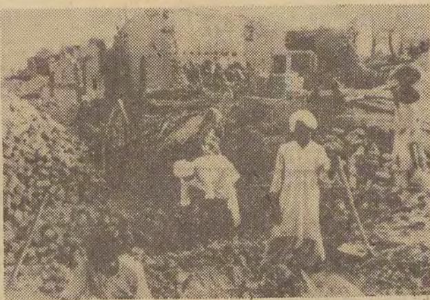
Lotnictwo indyjskie zbombardowało szereg miejscowości na tych terenach Pakistanu, na których zaobserwowano uchy wojak pakistańskich. Na zdjęciu: ludność cywilna na ruinach zbombardowanej wioski Kasur w Pakistanie.

Jedna z ukazujących się w Dżakarcie gazet podała w piątek do wiadomości, że w Penangku w zachodniej części Borneo wybuchł olbrzymi pożar. W wyniku pożaru 4 tys. osób straciło dach nad głową.