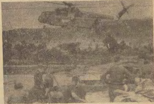
Przybyła do południowego Wietnamu z fortu Benninga w Georgii pierwsza amerykańska dywizja tzw. „kawalerii powietrznej” rozpoczęła instalowanie się w miejscowości An Khe na płaskowyżu wietnamskim w odległości 350 km na północny wschód od Sajgonu.

Przemysł elektromaszynowy ugruntował sobie w naszej gospodarce przodującą pozycję - dostarcza czwartej części produkcji przemysłowej. Zakłady tej gałęzi wytwarzają ponad 20 tys. wyrobów. W br. wytworzymy turbiny i generatory o łącznej mocy 570 MW (w 1960 r. - 186 MW). Polska jest jednym z 6 krajów europejskich budujących turbiny o mocy większej niż 100 MW.