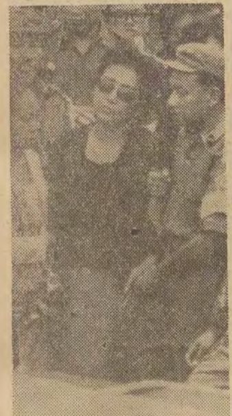
Zona b. szefa sztabu armii indonezyjskiej generała Achmada Yani opłakuje śmierć meża podczas nroczywości porzebowych. Ciało generała Yani oraz ciała pięciu innych generałów znaleziono we wspólnym grobie.

Najlepiej spisują się wykonawcy na budowach spółdzielczych. Pewne opóźnienia - mo żliwe do nadrobienia - notowane są tu wyłącznie w Krakowie, w województwach gdańskim i łódzkim. Gorzej nieco przedstawia się sytuacja w budownictwie rad narodowych. Wyniki uzyskane do końca września br. w budownictwie zakładowym nie są jeszcze znane. Natomiast prognozy dla budownictwa indywidualnego są pomyślne - przede wszystkim dzięki dobremu w tym roku zaopatrzeniu materiałowemu. W sumie można zakładać, że ostatni „rok budowlany” bieżącej 5-latki zakończy się pomyślnie. Oczywiście - zdecyduje IV kwartał, w którym przedsiębiorstwa wykonawcze muszą przyspieszyć tempo prac.