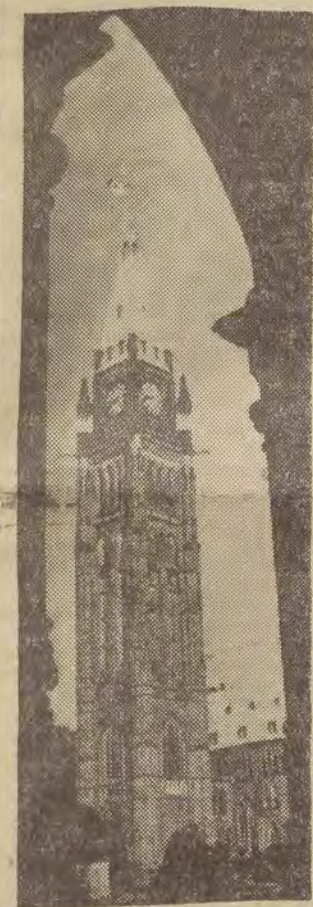
Wieża Pokoju — fragment gmachu parlamentu kanadyjskiego. Na szczycie wieży — nowa flaga państwowa Kanady z wizerunkiem liścia klonu.