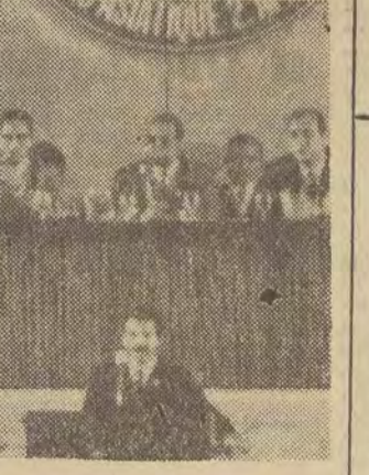
Otwarcie konferencji ministrów spraw zagranicznych krajów Azji i Afryki. Przemawia delegat Algierii min. Abdelaziz Buteflika. Pod emblematem konferencji przewodniczy min. Mohamed Bedjaoui (w środku).

W poniedziałek w późnych godzinach wieczornych w sali Club des Pins zakończyła obrady konferencja ministrów spraw zagranicznych krajów Afryki i Azji. Obrady konferencji, w których uczestniczyły delegacje 45 państw, trwały trzy dni. Na końcowym posiedzeniu konferencji uchwalono rezolucję o odłożeniu konferencji afro-azjatyckiej na termin późniejszy.