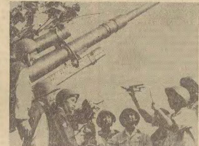
Klasyczna artyleria przeciwlotnicza (doskonale zorganizowana w DRW) okazała się skutecznym środkiem walki przeciw najnowszemu typowi samolotów amerykańskich, dokonujących nalotów na terytorium północnego Wietnamu. Na zdjęciu: żołnierze jednostki obrony przeciwlotniczej DRW, którzy zestrzelili pierwszy odrzutowiec amerykański typu „A-302”.

Na przedmieściu kairskim Agaza wydarzył się w poniedziałek rano groźny wypadek drogowy, w którym zginęło przypuszczalnie ponad 100 osób. Z nie ustalonych dotąd przyczyn trolejbus przepelniony pasażerami opuścił szosę i wpadł do Nilu. W sześć godzin po wypadku nurkowie wydobyli na brzeg zwłoki 62 ofiar i zechodził obawa, że w katastrofie zginęło ponad 100 osób, 19 pasażerem udało się w ostatnim momencie wydostać z tonącego trolejbusu.