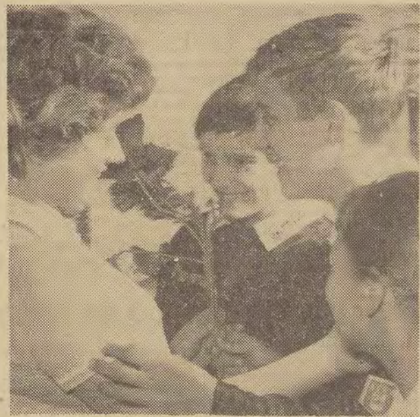
Dzieci Szkoły nr 64 na Dąbrowie — swojej kierowniczce.