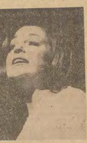
W koncercie w dniu 6 grudnia br. z zespołem Wojciecha Karolaka wystąpiła Annie Ross z Wielkiej Brytanii. Jest ona uznana za jeden z największych talentów wokalistyki jazzowej ostatnich lat. Jej kariera rozpoczęła się od nagrania, wspólnie ze znakomitymi wokalistami amerykańskimi: Dave Lambert i John Hendris, albumu płyt poświęconego aranżacjom Count Basiego. To były narodziny najdoskonalszej grupy wokalistycznej na świecie. Wkrótce potem krytycy zgodnie uznali, że Lambert - Hendris - Ross, to najbardziej „hot” śpiewająca grupa, jaką można było dotychczas usłyszeć. Oprócz tego albumu Annie Ross nagrała wiele własnych płyt, a m. in. słynny album „Annie Ross a Song With Mulligan” i płytę z Kwartetem Zoot Simsa.

NA ZDJĘCIU: Annie Ross śpiewa...