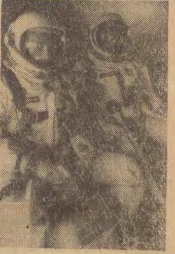
Na zdjęciu: W. Schirra (po lewej) i T. Stafford - podczas prób przystosowania się do warunków lotu orbitalnego.

„Gemini-6” wystartował z Przylądka Kennedy'ego o godz. 14.37 czasu warszawskiego i 6,5 minuty później wszedł na orbitę eliptyczną 162-265 km, tylko nieznacznie odbiegając od planowanej. „Gemini-7” z kosmonautami Bormanem i Lovellem zaczął wówczas 162 okrążenie. „Gemini-7” biegł po niemal kołowej orbicie na wysokości około 500 km. W chwili gdy „Gemini-6” zaczął na pierwsze okrążenie, jego bliźniaczy statek znajdował się 1.920 km przed nim i na znacznie wyższej orbicie.