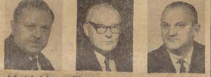
Jak już informowaliśmy w dniu 14 bm. Sejm dokonał wyboru Mieczysława Klimaszewskiego na zastępcę przewodniczącego Rady Państwa, natomiast Edwarda Sznajdera powołał na stanowisko ministra handlu wewnętrznego, a Henryka Jabłońskiego na stanowisko ministra szkolnictwa wyższego. Na zdjęciu (od lewej): M. Klimaszewski, H. Jabłoński i E. Sznajder.