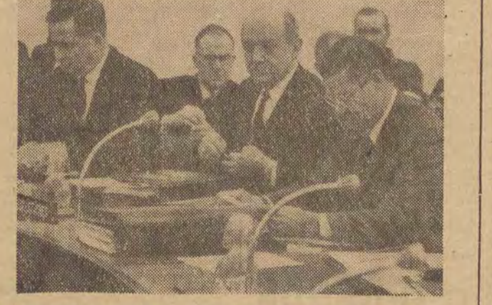
We wtorek, 14 grudnia, rozpoczęła się w Paryżu kolejna konferencja ministrów NATO. Obrady, które odbywają się w Pałacu Dauphine, są tajne. Na zdjęciu: (od lewej) brytyjski minister obrony Denis Healey, amerykański sekretarz stanu Dean Rusk i minister obrony USA Robert McNamara na sali obrad w dniu otwarcia konferencji.

nych liczbowych, ilustrujących rozwój wysiłku militarnego ChRL w dziedzinie zbrojeni klasyfikacyjnych i nuklearnych. W związku z tym zaproponował, by rada stałych przedstawicieli NATO dokładnie przedstawiła ten problem. Przechodząc do zagadnień bardziej „atlantyckich” sekretarz obrony USA wyzwał do udoskonalenia sił interwencyjnych NATO.