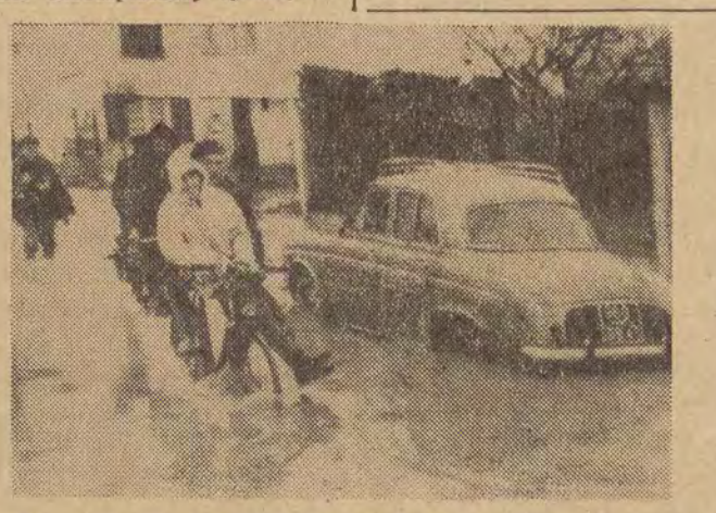
Już piąty raz tej zimy, po obfitych deszczach w południowo-zachodniej Francji wystąpiła z brzegów rzeka Garonna. Szereg miejscowości zostało zalanych przez wezbrane wody. Mieszkańcy dotkniętych powodzią rejonów są ewakuowani.

Loara zalala niżej położone ulice w Nantes. W innych rejonach setki domów trzeba było ewakuować. Jedyną nadzieją na zapobieżenie wielkiej klęsce powodzi jest nowa fala zimna, która już przed 10 dniami pomogła w opanowaniu równie niebezpiecznej sytuacji.