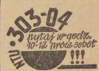
DODATEK DO RENT

Wreńcem nagród zwycięzcom konkursu odbedzie się w środę, 12 stycznia br. o godz. 17 w Klubie Dziennikarza, ul. Piotrkowska 96 I piętro. (wit)