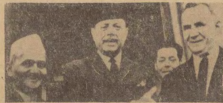
N/z: premier Shastri (z lewej), prezydent Ayub Khan (w środku) i premier Kosygin po zdjęciu z wspólnego zdjęcia po pierwszej turze rozmów w Taszkencie.

Na obrady przybył członek Biura Politycznego KC PZPR, premier Józef Cyrankiewicz.