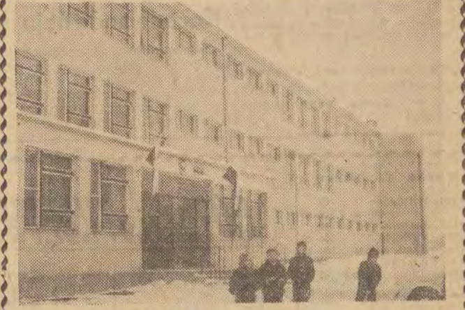
Wczoraj, z okazji 21 rocznicy wyzwolenia Łodzi, na Dąbrowie — Zachód przy ul. Kadubka 33 odbyło się oficjalne przekazanie do użytku nowego gmachu Szkoły Podstawowej nr 173. W uroczystości tej wzięli udział przedstawiciele władz partyjnych i dzielnicowych. Kuratorium oraz kierownictwo szkoły, członkowie komitetu rodzicielskiego i uczniowie.

Nowa szkoła, w której nauka odbywa się już od 1 września ubiegłego roku, posiada 15 izb lekcyjnych, 32 klasy, 4 pracownie naukowe oraz piękną salę gimnastyczną. (J. Kr.)