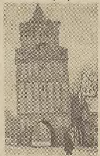
Chojna (woj. szczecińskie) to stare osiedle słowiańskie, które w wieku XIII weszło w skład Nowej Marchii, a począwszy od wieku XV należało do Brandenburgii. Miasteczko posiada wiele cennych zabytków przeszłości, a m. in. XV-wieczne bramy i mury obronne oraz ratusz.

aresztu, a stąd prosta już droga na salę sądową i do więzienia z prawomocnymi wyrokami.