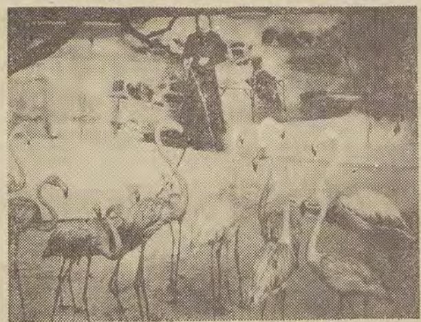
W ogrodzie zoologicznym w Pradze istnieją obok normalnych wybiegów, klatek i pomieszczeń dla zwierząt — także specjalne pawilony ogrzewane, w których co wrażliwi pensjonariusze przecekują okres zimowych mrozów. Na zdjęciu: stadka flamingów w ogrzewanym pawilonie praskiego ZOO.