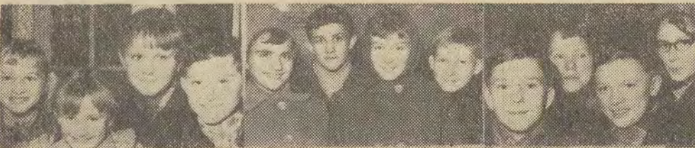
Kl. III c Szkoły nr 20, kl. VI-a Szkoły nr 175, Koło PCK przy Szkole nr 152.