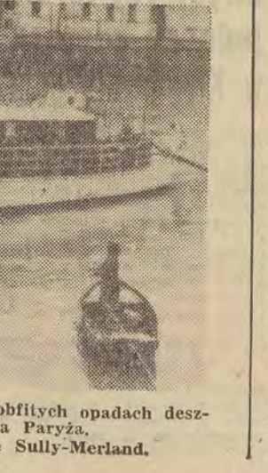
Masy wód po nagłym ociepleniu i obfitych opadach deszczu zalały przedmieścia Paryża. Na zdjęciu: bulwar przy moście Sully-Merland.