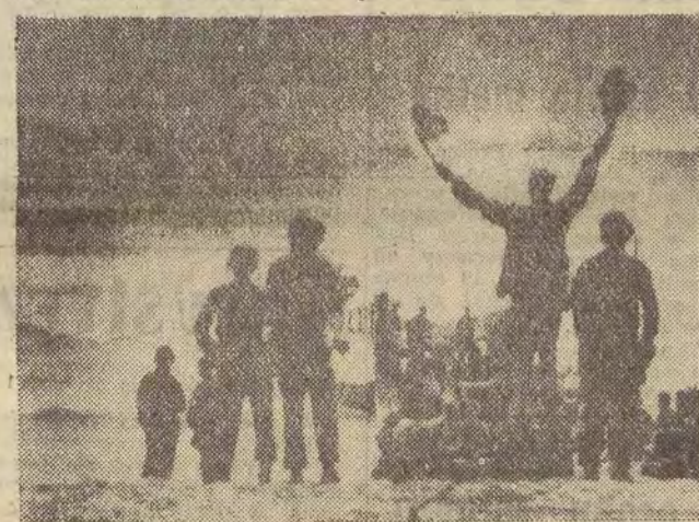
W rejonie Quang Ngai w piątek, 23 stycznia nastąpiło wyładunek nowego desantu piechoty morskiej, w sile 4000 ludzi. Akcja ta utrzymywana była w tajemnicy ze względu na możliwość ataku ze strony partyzantów. Jest to największa akcja desantowa dokonana przy pomocy amfibii od czasu słynnej akcji pod Inchon podczas wojny koreańskiej. (D) Dalszy ciąg na str. 2

Samoloty USA dokonały czterech nalotów na DRW. Według pierwszych doniesień, w poniedziałek zestrzelonych zostało nad DRW pięć samolotów amerykańskich, a wiele zostało uszkodzonych.