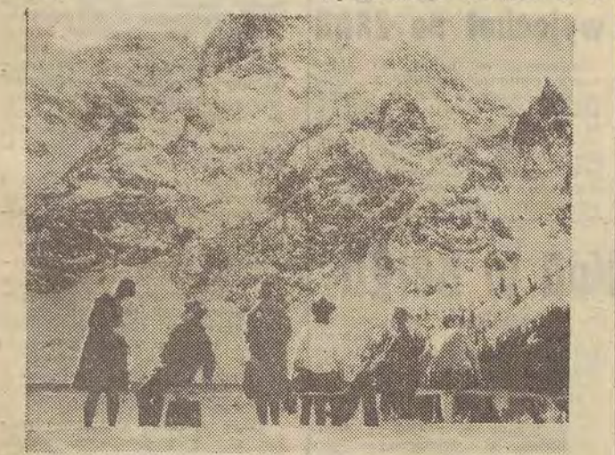
Turyści zakopiańscy korzystają z pięknej pogody, by udać się nad Morskie Oko, gdzie można się wspaniale opalić.

Ubiegła 5-latka przyniosła zwiększenie liczby miejsc noclegowych w obiektach turystycznych z 168 tys. do 329 tys., a więc blisko 100 proc., a w kwaterach prywatnych z 220 tys. do 400 tys. W tym samym okresie liczba miejsc w zakładach gastronomicznych wzrosła o 93,8 tys. miejsc, czyli ok. 30 proc. Znaczna poprawa w tej dziedzinie nastąpiła w 68