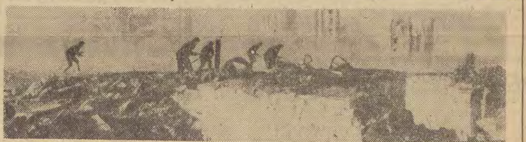
Na zdjęciu: kolejny atak radzieckiej piechoty na pozycje hitlerowców w Stalingradzie.

W 1942 r. - (po klęsce pod Moskwą) - wojska hitlerowskie rozpoczęły w czerwcu nową ofensywę, tym razem w kierunku południowo-wschodnim. Chodziło w niej głównie o odcięcie północny Kraju Rad od rozpoznanych terenów kaukaskich. Osiągnięta została przetrzymana 1 IX 1942 r. pod Stalingradem. Rozpoczęły się niezwykle zacięte walki o miasto, trwające z górną 5 miesięcy. Kontrofensywa radziecka rozpoczęła 19 XI 1942 r. doprowadziła do okrążenia około 300 tys. wojsk w rejonie stalingradzkim. Mimo podejmowanych prób przerwania pierścienia okrążającego, do dnia 21. 1943 r. kocioł został zlikwidowany, a resztki wojsk niemieckich pod dowództwem feldmarszałka Paulusa skapitulowały. Zniszczenie doborowych jednostek hitlerowskich pod Stalingradem stanowiło punkt zwrotny w dalszych działaniach wojennych. Od tego czasu rozpoczęła się seria sukcesów Armii Radzieckiej, zakończona w dwa lata później zdobyciem Berlina. (ZZ)