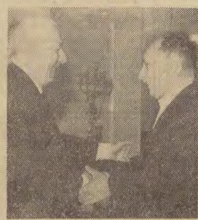
Bawiąca w Indii delegacja Sejmu PRL z marszałkiem Czesławem Wycechem na czele, zatrzymała się 7 bm. w Moskwie.

Dopiero we wtorek wczesnym rankiem udało się opanować groźny pożar, który przez wiele godzin szalał w mieście Iloilo w południowej części Archipelagu Filipińskiego. Blisko połowa miasta została całkowicie zniszczona, a liczba śmiertelnych ofiar wzrosła do 18. Los 12 ludzi jest nieznanym. Korespondent Reutera pisze, że był to największy pożar na Filipinach w ciągu ostatnich 20 lat.