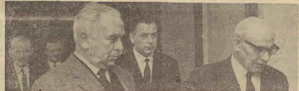
Na zdjęciu: podczas wizyty w gmachu KC w Warszawie — Wł. Gomułka i Luigi Longo (z lewej).