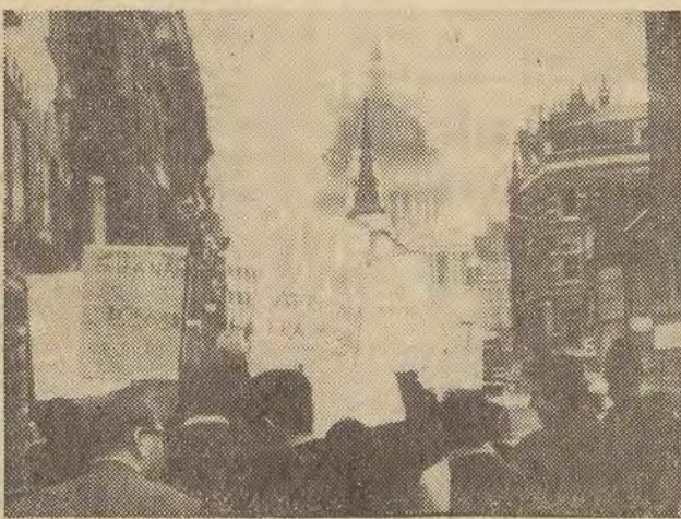
Studenci afrykańscy w Europie protestują przeciw obaleniu prezydenta Ghany Nkrumah przez reakcyjne koła wojskowe. W środę, 2 marca w centrum Londynu odbyła się demonstracja studentów, którzy domagali się zaprzestania ingerencji neokolonialistów w krajach Afryki i wyrażali swoje poparcie dla linii polityki, jaką prowadził Nkrumah. Na zdjęciu: demonstrujący studenci afrykańscy maszerują na Fleet Street w centrum Londynu.