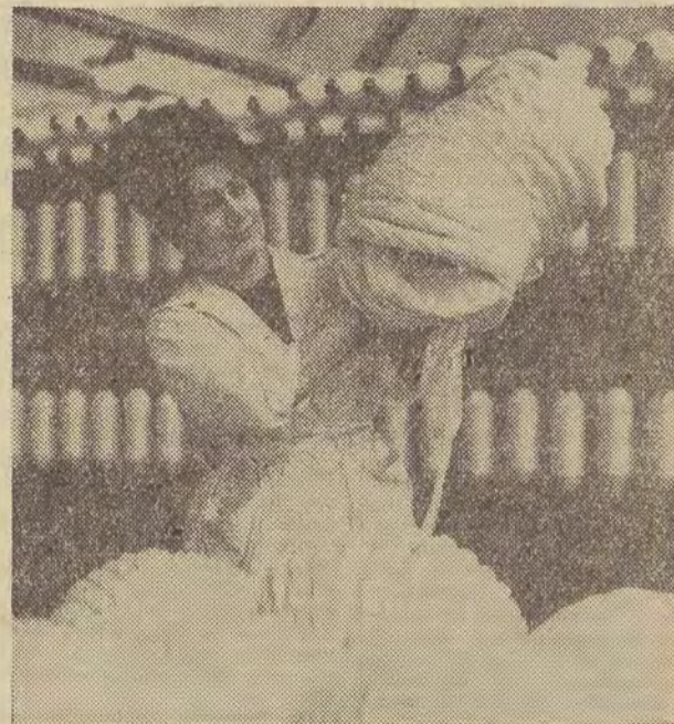
Na zdjęciu: w oddziale przygotowawczym przedalni Zakładów Przemysłu Bawełnianego im. Armii Ludowej w Łodzi.

Po raz trzeci obchodzić będzie jutro swe doroczne święto ponad półmilionowa armia robotników, techników i inżynierów przemysłu lekkiego. Znany z ich wyrobów, z którymi stykamy się co dzień, oni wszak ubierają nas od stóp do głów — w białiznę, gar-