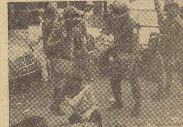
Mimo pewnych ustępstw wobec ludności Wietnamu południowego, jakie w ostatnich dniach przejawia rząd sajgoński...

Według informacji agencji zachodnich, lotnictwo amerykańskie bombardowało we wtorek wielokrotnie wyrzutnie rakietowe w DRW.