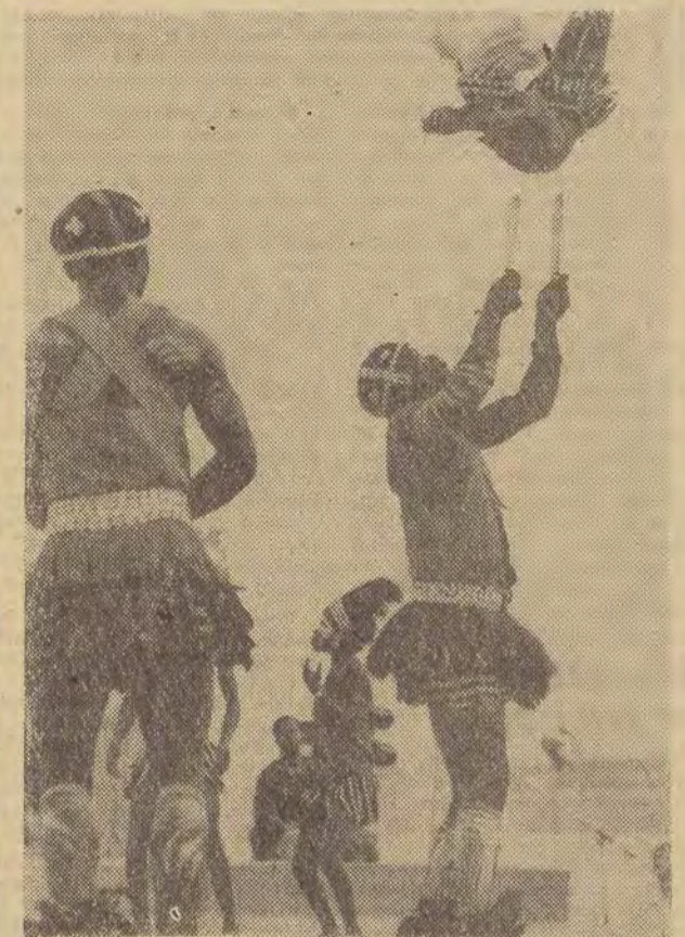
Podczas odbywającej się obecnie w stolicy Senegalu, Dakrze — I Światowej Wystawy Sztuki Murzyńskiej — oprócz ekspozycji rzeźb, malarstwa i arcydzieł rzemiosła artystycznego ludów afrykańskich — ważnym elementem artystycznym są występy przybyłych z różnych republik Czarnego Łądu zespołów tanecznych i muzycznych.

Na zdjęciu: taniec w wykonaniu zespołu Wybrzeża Kości Słoniowej.