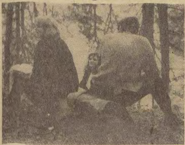
Przyjemniej jest przygotowywać się do egzaminów w parku niż w ciasnym pokoju domu akademickiego...