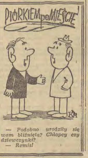
Podobno urodzili się wam bliźnięta? Chłopcy czy dziewczynki? - Remis!

Na terenie placu budowy Politechniki Łódzkiej na ul. Gdańskiej pracuje największy w Łodzi dźwig - 120 tonometrów. „Szczecina” sprostowana aż ze Szczecina. Jest to autentyczny dźwig portowy, a takich jak wiadomo, nie ma w centrum kraju. Aktualnie trwa montaż podobnego urządzenia. Nowy dźwig będzie jednak trochę mniejszy, tylko 90 tonometrów. (iw)