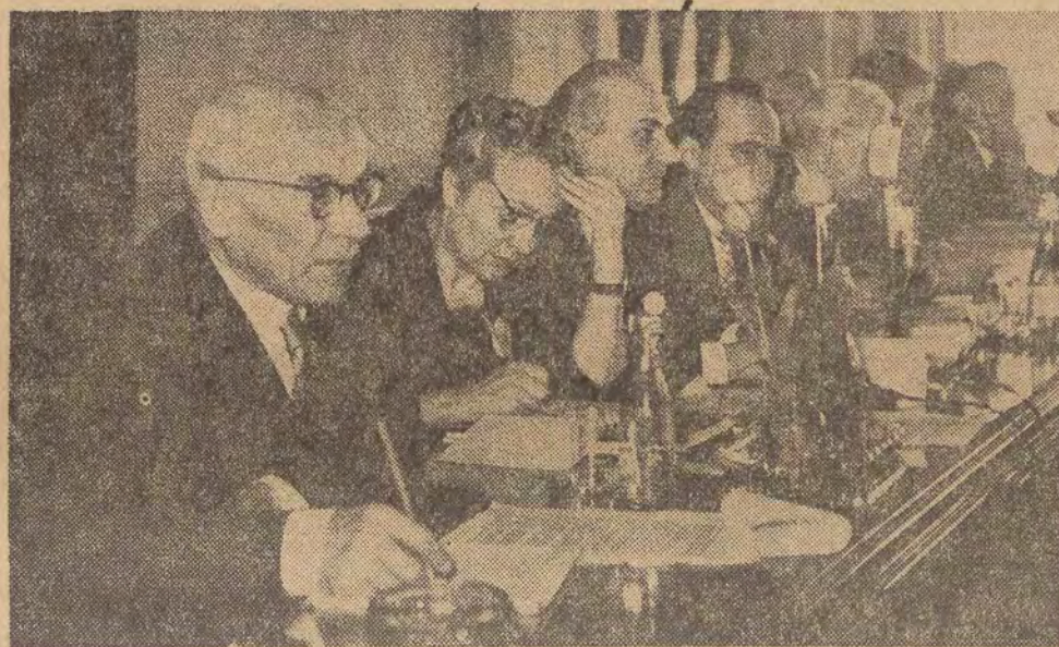
Prezydium wczorajszych obrad łódzkiej konferencji partyjnej.

W bieżącej 5-letce na budownictwo szkół, żłobków, przedszkoli, domów kultury, ośrodków zdrowia i obiektów sportowych w Łodzi przeznaczono aż 2,240 mln zł, tj. o