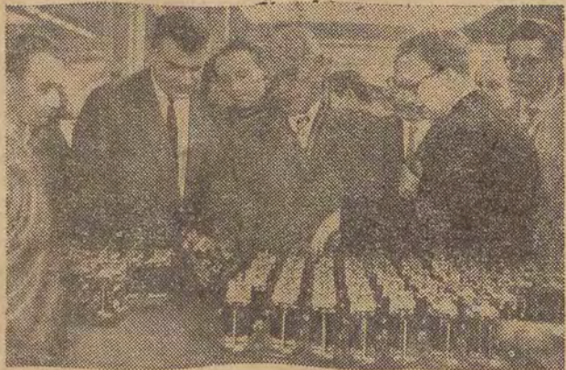
Na zdjęciu: Władysław Gomułka w fabryce na Żabieńcu.