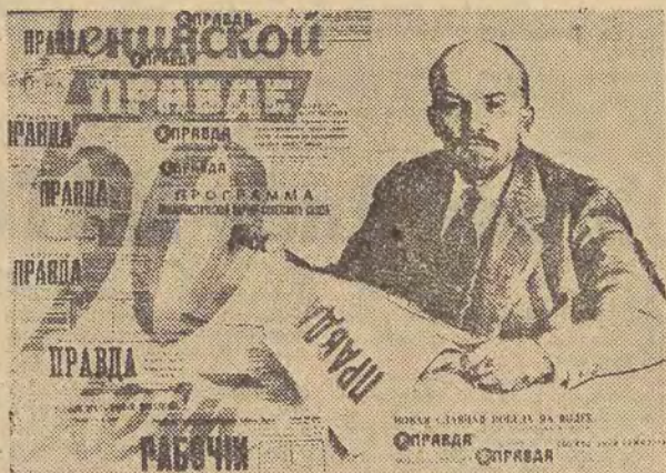
Plakat okolicznościowy wydany w Moskwie.