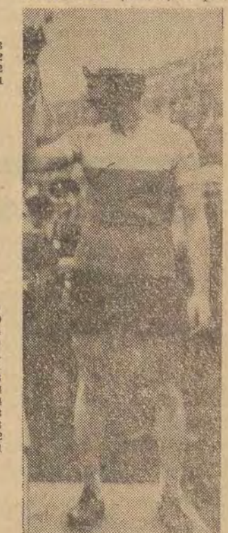
Ziełiński na podium