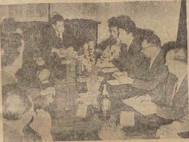
Z okazji Tygodnia Ziem Zachodnich zastępcą przewodniczącego Rady Państwa prof. St. Kulczyński przyjął w dniu 9 maja 1962 r. delegację województwa kuszalińskiego.