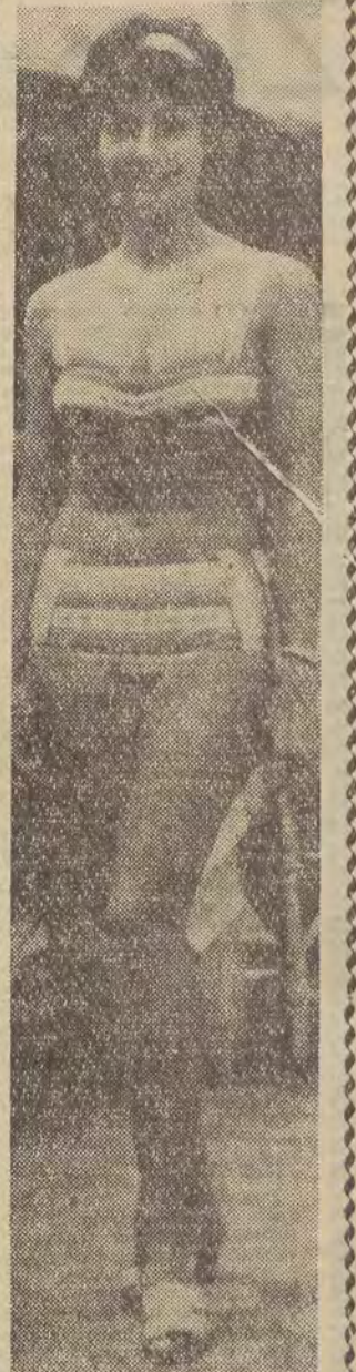
W Budapeszcie odbył się pokaz modeli kostiumów kapeluszowych na rok... 1953. Oto jeden z modeli.

Rzecz jest tak prosta, że też nikt na to jeszcze dotychczas nie wpadł.