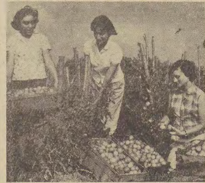
Zbiór pomidorów we wsi Fielowo, przeznaczonych na eksport.

twórczą siłę „drożdży społecznych” zrodzonych przez zwycięskie powstanie. Bułgaria dziś — to nie tylko kraj pachnący róż, zielonego groszku i pomidorów. To państwo, którego udział w światowym handlu, dorobku