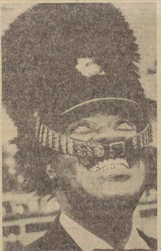
Louis Armstrong w imponującej czapce, jaką noszą chłopcy z kopenhaskiego „Wesołego miasteczka” Tivoli „Sathmo” odwiedził Kopenhagę z okazji 150-lecia urodzin założyciela Tivoli — Georga Carstensa.