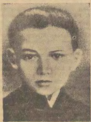
BOLESŁAW BIERUT w Lublinie w 1905 roku.