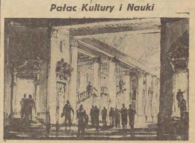
Na zdjęciu: projekt wnętrza jednej z sal.

Deklaracja wymienia w szczególności plan Schumana i „układ ogólny” oraz podkreśla, że pakt atlantycki wymaga od