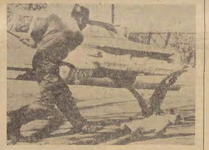
W Neighbourhood — przedmieściu Chicago wydarzył się w biały dzień niecodzienny wypadek. Orzeł zaatakował na ulicy małego psa. Przechodnie uratowali pieska. Orzeł został ogłuszony uderzeniem kija i znalazł się za siatką ogrodu zoologicznego. Fotoreporter miał szczęście, będąc świadkiem tego naprawdę niecodziennego wypadku.