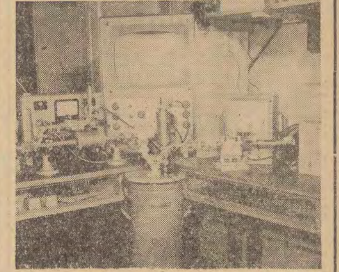
W pracowni fal ultrakrótkich Instytutu Fizyki PAN uruchomiono kwantowy wzmacniacz mikrofalowy, tzw. maser. Urządzenie to pozwala wzmacniać i obserwować sygnały radiowe o ultrawysokiej częstotliwości m. in. szumy przychodzące z odległych galaktyk oraz sygnały przesyłane przez statki kosmiczne, znajdujące się poza naszym układem słonecznym. Masery takie uruchomiono dotychczas w ZSRR, USA, Anglii i Japonii. Na zdjęciu: maser.