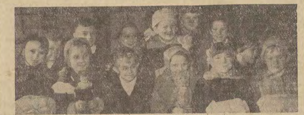
Przednio odesłaliśmy kilka tysięcy książek, oraz odzież ofiarowaną przez Technikum Samochodowe. W ostatniej partii znalazły się książki, gry, odzież i naturalnie mnóstwo zabawek. Ledwo opuszczała duża szafa, a już zaczęła się napełniać nowymi darami.

W DNIE WCZORAJSZYM PRZEKAZALISMY ZARZĄDOWI ŁÓDZKIEMU TPD TRZECIE Z KOLEI AUTO PODARUNKÓW OTRZYMANYM OD NASZYCH CZYTELNIKÓW.