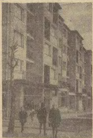
Piotrków — ul. Jagiellońska Rok XXI