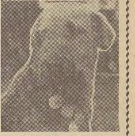
Medalistka Katia Bedlington Terrier z Warszawy.