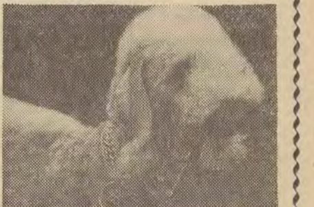
Oryginalny Airedale Terrier — pies łódzki.