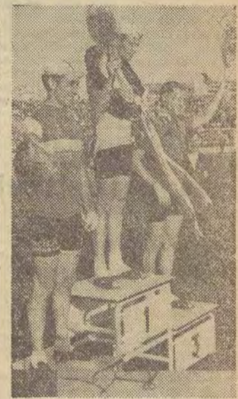
Zwycięzca na podium.

aż do przodu zasadniczej grupy. (Dalszy ciąg na str. 6)