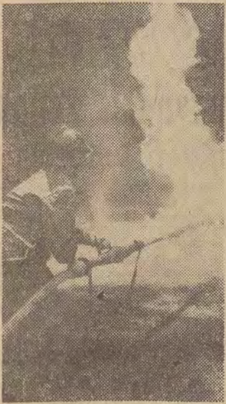
Na zdjęciu: Łódzki strażak w akcji bojowej. Tak odbywa się gaszenie płynów łatwopalnych przy pomocy piany gaśniczej.

Ekipy łódzkiej straży pożarnej brały udział w ub. roku w akcji ogniowej prawie tysiąc razy. Ale oprócz tego interweniowały w 1400 innych nagłych wypadkach. Dotyczyły one rozbiórki walących się domów, usuwania z ulic rozbitych pojazdów mechanicznych i pomocy w katastrofach kolejowych i budowlanych. Strażacy brali też u-